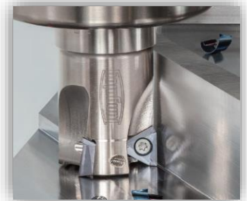
TungTri-Eckfräser 3 effektive Scheiden